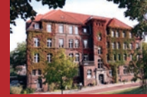
biz Bildungszentrum für Pflegeberufe Spandauer Damm 130, 14050 Berlin