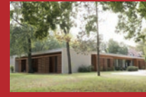
DRK Kliniken Berlin Hospiz Köpenick Salvador-Allende-Straße 2-8, 12559 Berlin