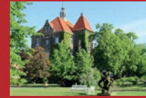
DRK Kliniken Berlin Westend Spandauer Damm 130, 14050 Berlin