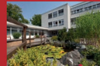
DRK Kliniken Berlin Pflege und Wohnen Mariendorf Britzer Straße 91, 12109 Berlin