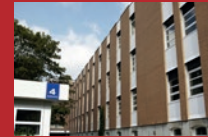
DRK Kliniken Berlin Mitte Drontheimer Straße 39-40, 13359 Berlin