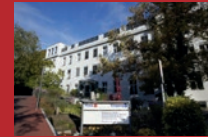
DRK Kliniken Berlin Wiegmann Klinik Spandauer Damm 130, 14050 Berlin