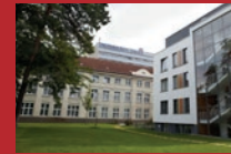
DRK Kliniken Berlin Köpenick Salvador-Allende-Straße 2-8, 12559 Berlin